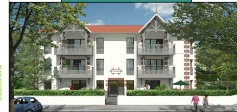
PLAN NIVEAU RDC