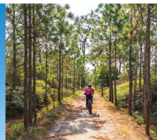
Deuxième ville du Pays Basque français, Anglet offre un cadre de vie inégalé