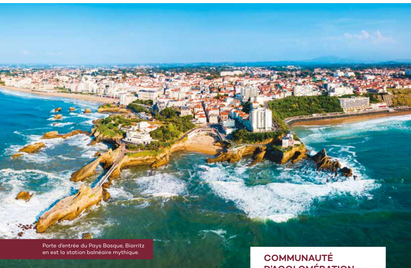
Porte d'entrée du Pays Basque, Biarritz en est la station balnéaire mythique.